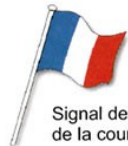
Signal de départ de la course