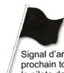
Signal d'arrêt au prochain tour pour le pilote dont le N° est présenté