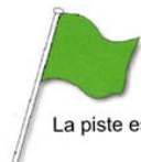
La piste est libre