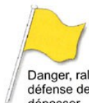
Danger, ralentir, défense de dépasser